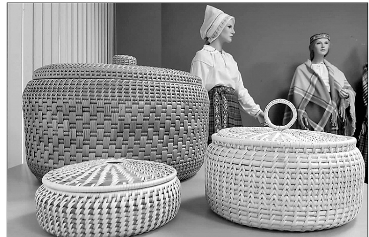
Ina savus smalkos un rūpīgos pinumus veido no šķeltajām klūdžiņām