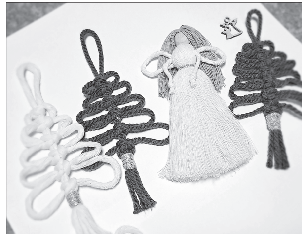
Makramē tehnikā Viktorija veido arī puķupodu turētājus, sienas dekorus, salvešu turētājus, piekariņus un eglīšu rotājumus

«Projektu finansē Mediju atbalsta fonds no Latvijas valsts budžeta līdzekļiem». «Par projekta raksta «Makramē tehnikā darina auskarus» saturu atbild SIA «Vietēja»».