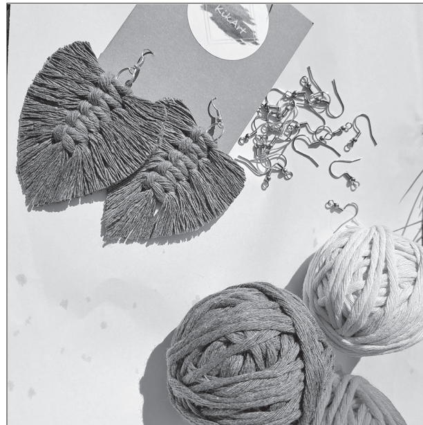
«Auskaru izskats, kas tiek veidots makramē tehnikā, ir dabisks, un kas ir ļoti būtiski – diegi dabā sadalās, paliek pāri tikai auskaru āķīši,» atklāj meistare