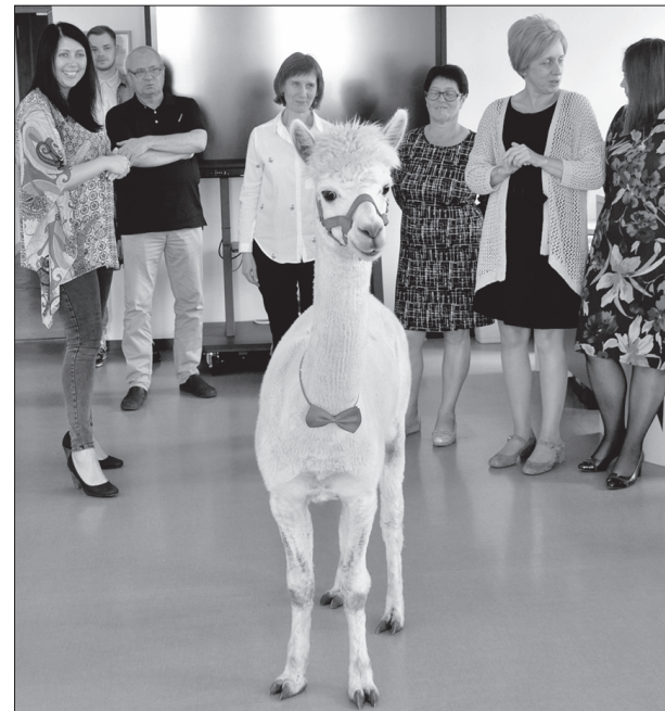
Alpaka Tomass prot ļoti labi uzvesties sabiedriskās vietās un viņam patīk cilvēki

2019. gadā mini zoo «JuRita» Daugavpils novada konkursā «Saimnieks» saņēma balvu kā labākie aktīvāko tūrisma uzņēmēju vidū. Piecu gadu laikā mini zoo ir izaudzis un kļuvis atpazīstams arī ārpus Daugavpils novada, jo te brauc interesenti ne vien no tuvākām, bet arī tālākām vietām. Ir pārvarēti daudzi grūti brīži, jo saimnieki ir spē-