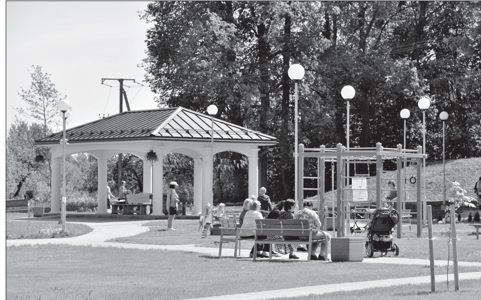
Eļņas Teičevas unaines foto

Līdzās Vārkavas muižas parkam ierīkoto Vecvītolu parku rotā lapene, vingrošanas laukums, soli u.c. aprīkojums