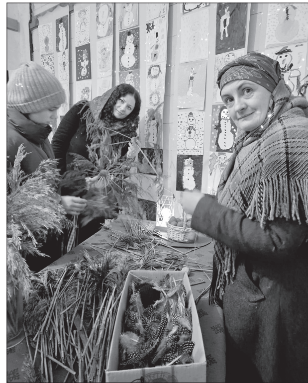
Gaitas Antromkreas foto

Krāslavā 16. decembrī ikviens varēja izmantot kopienas radošais kvartāls “ILA” piedāvāto aktivitāti un izgatavot Ziemassvētku tradicionālos rotājumus puzurus kopā ar folkloras kopas “Primačkas” sievām