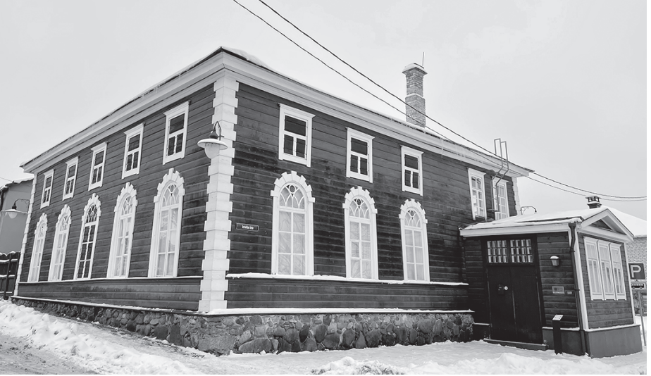
Zaļā sinagoga kalpo kā lūgšanu sakrālā un tūrisma celtnē, tur notiek arī koncerti