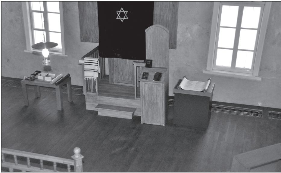
Zaļās sinagogas lūgšanu telpa