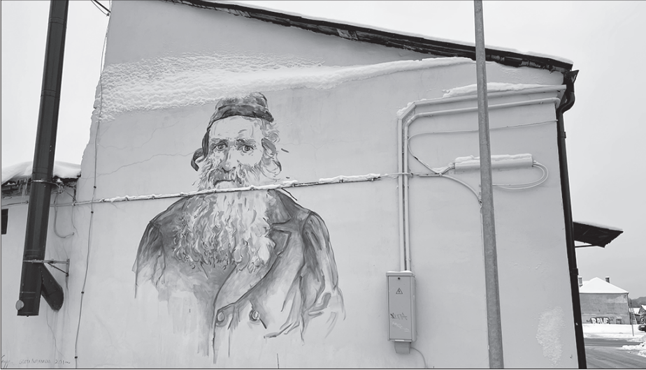
Netālu no Zaļās sinagogas atrodas 19. gadsimta ebreja portrets, uzgleznots uz mājas sienas

Tu Bševat (Tu B'Shevat) – ševata mēneša (janvāris – februāris) piecpadsmitā diena, kas rabīniskajos avotos minēta kā jaunais gads augļu kokiem, paiet praktiski bez rituāliem. Taču šie svētki ir saistīti ar sekulārām interpretācijām – diena, kurā cilvēki, jo īpaši skolnieki, stāda kokus.